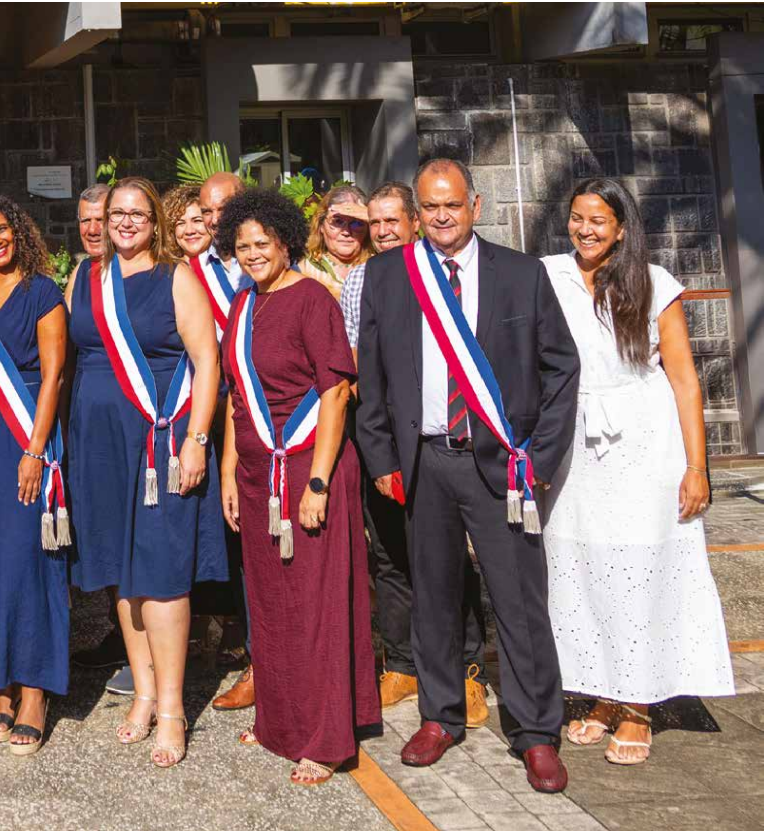
Photo de l'équipe municipale-07