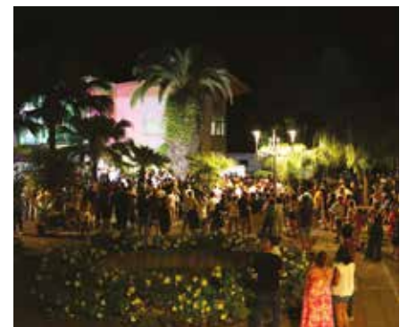
Proclamation des résultats à la population