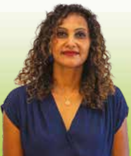
AMYCLAS Reine Claude 8 ème adjointe