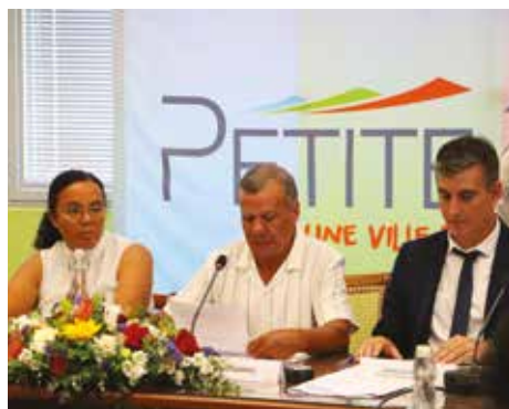
Conseil municipal du samedi 21 mars 2026