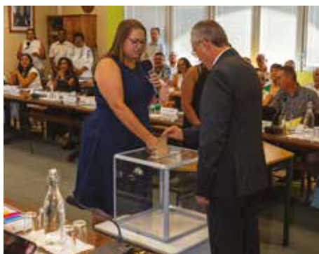
Vote des élus - Élection du Maire