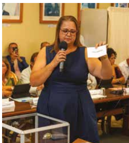
Conseil municipal du samedi 21 mars 2026