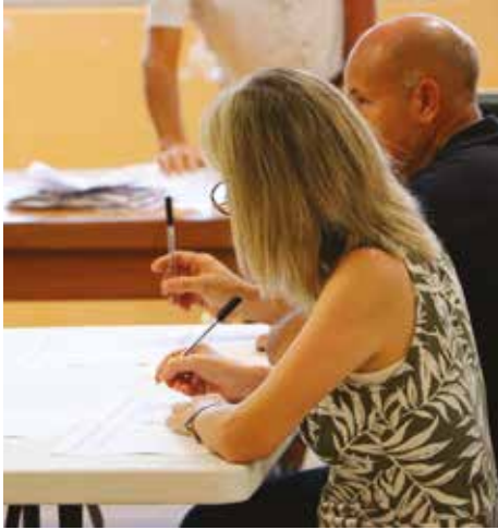
Soirée du dimanche 15 mars 2026