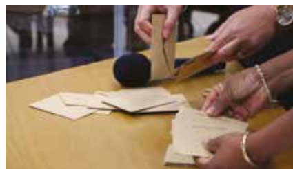
Dépouillement du vote - Élection du Maire