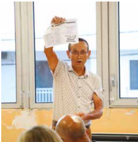
Dépouillement des bulletins