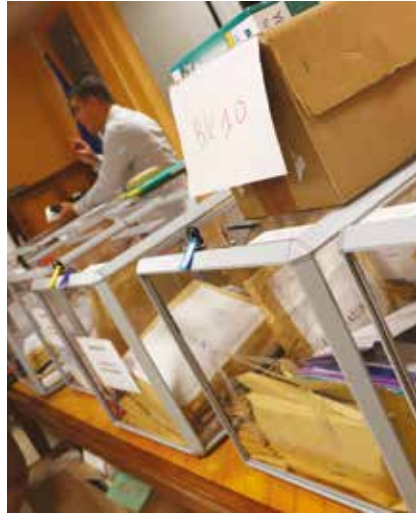
Les urnes arrivent au bureau centralisateur