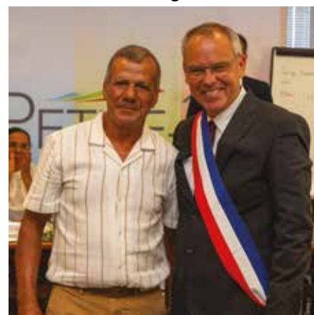
Conseil municipal du samedi 21 mars 2026