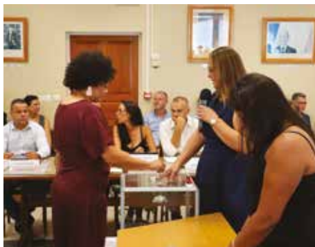
Conseil municipal du samedi 21 mars 2026