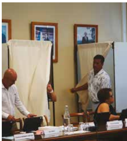
Vote des élus - Élection du Maire