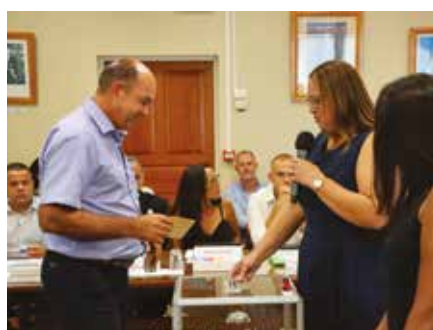
Conseil municipal du samedi 21 mars 2026