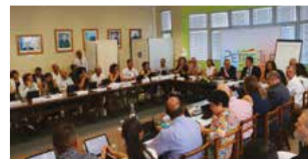
Diffusion de l'installation dans la salle des mariages