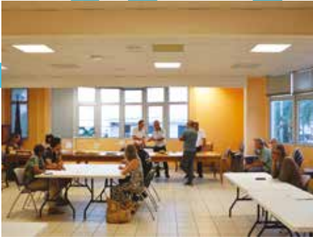
Dépouillement des bulletins