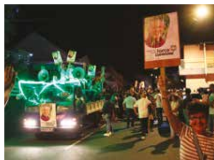
Soirée du dimanche 15 mars 2026