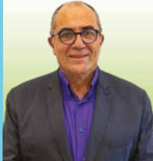
FORT Olivier 9 ème adjoint