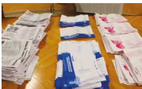
Soirée du dimanche 15 mars 2026