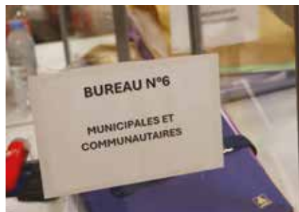
Proclamation des résultats à la population