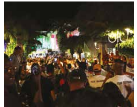
Soirée du dimanche 15 mars 2026