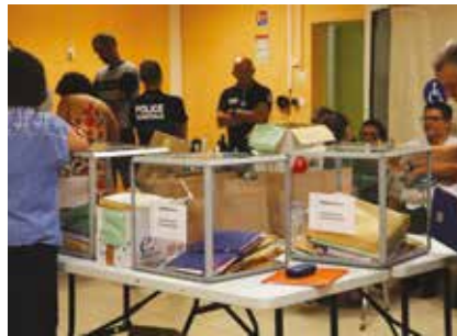
Soirée du dimanche 15 mars 2026