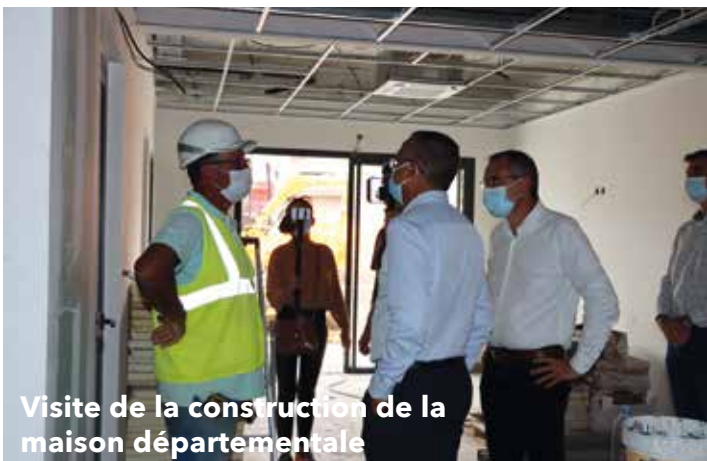
Visite de la construction de la maison départementale