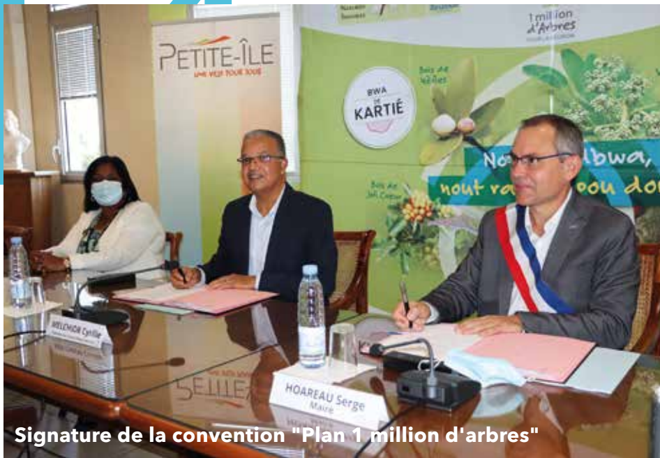
Signature de la convention "Plan 1 million d'arbres"