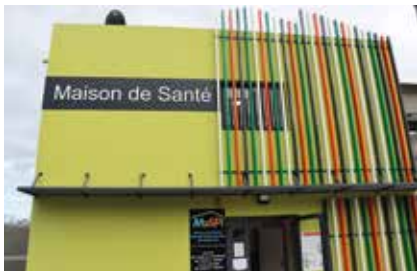
Inauguration de la MASPI (MAison de Santé de Petite-Île)