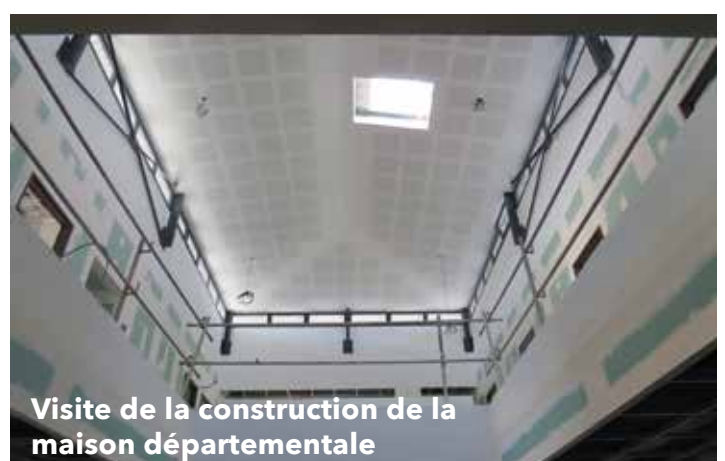
Visite de la construction de la maison départementale