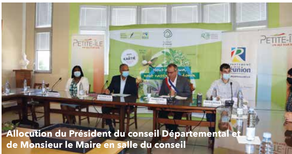
Allocution du Président du conseil Départemental et de Monsieur le Maire en salle du conseil