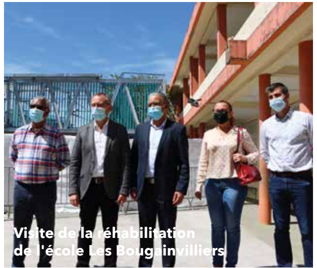
Visite de la réhabilitation de l'école Les Bougainvilliers