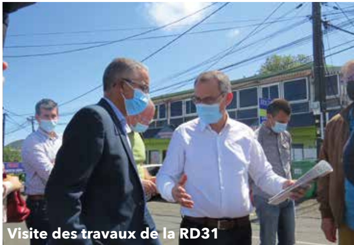
Visite des travaux de la RD31