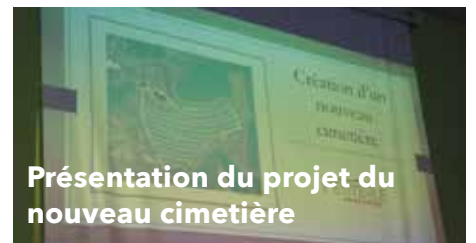
Présentation du projet du nouveau cimetière