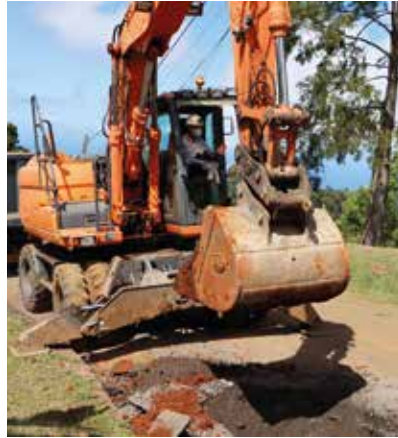
Premier coup de pelle du lancement du chantier d'Adduction en Eau Potable (AEP) à Manapany les Hauts