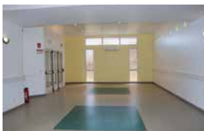
Inaugurations du local gamer à Manapany les Bas