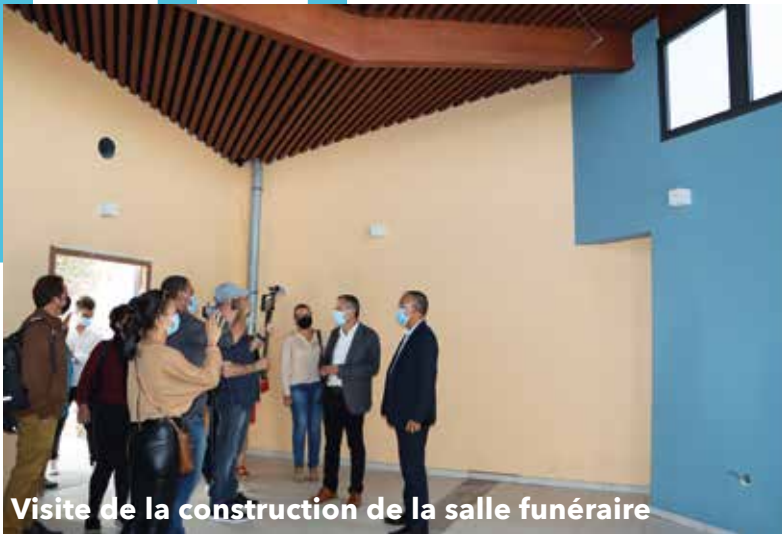
Visite de la construction de la salle funéraire