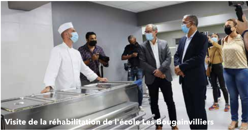
Visite de la réhabilitation de l'école Les Bougainvilliers