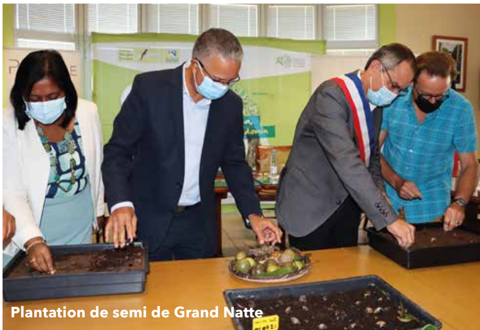
Plantation de semi de Grand Natte