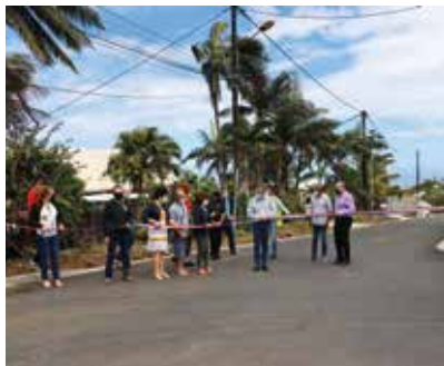
Inaugurations des rues Achille Bénard et Joseph Lacarre