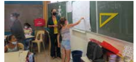
Projet OMBREE dans les écoles Fleurs de Canne et Les Alpinias