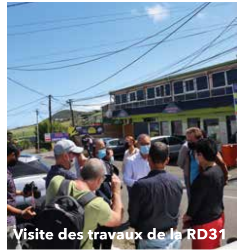
Visite des travaux de la RD31