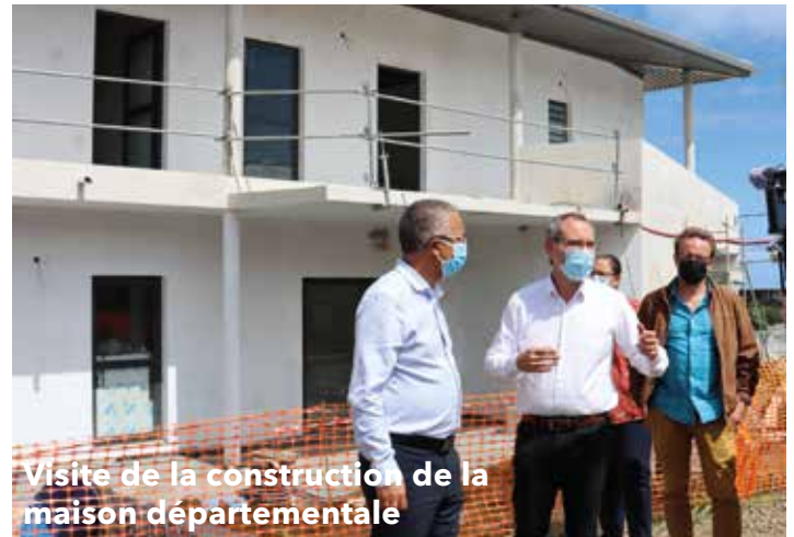
Visite de la construction de la maison départementale