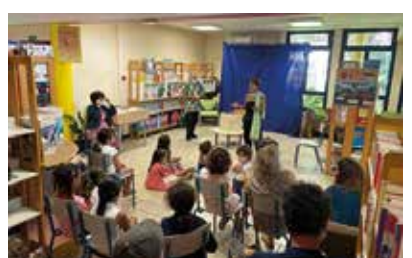
Conte « À l'école de la Forêt » à la Bibliothèque du Centre-Ville