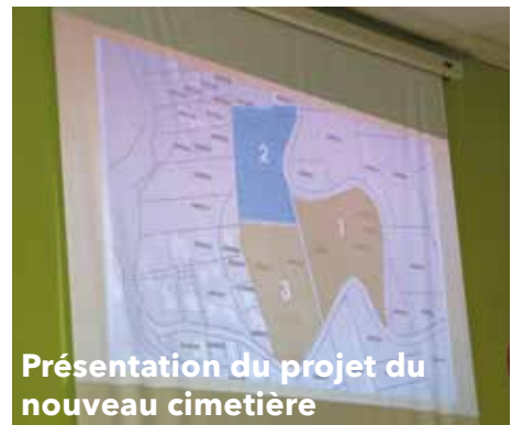
Présentation du projet du nouveau cimetière