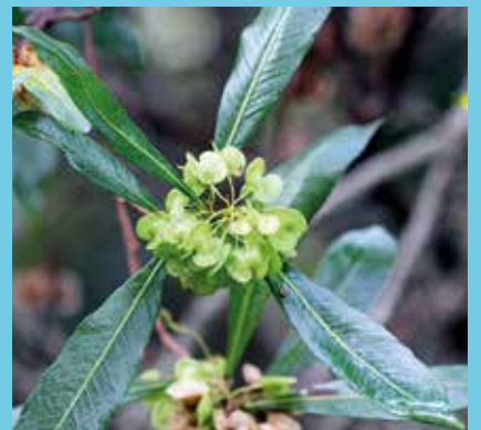
Le bois de Reinette