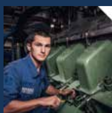
MÉCANIQUE ET MAINTENANCE