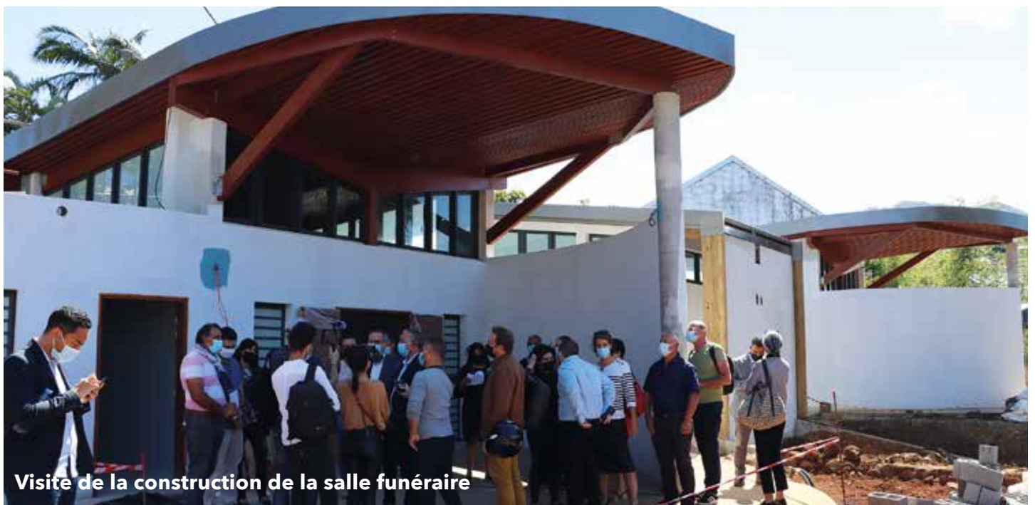
Visite de la construction de la salle funéraire