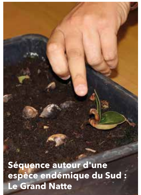
Séquence autour d'une espèce endémique du Sud : Le Grand Natte