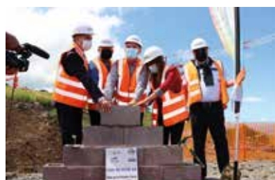
Pose de la première pierre de l'Unité de Traitement des Eaux Pluviales (UTEP)